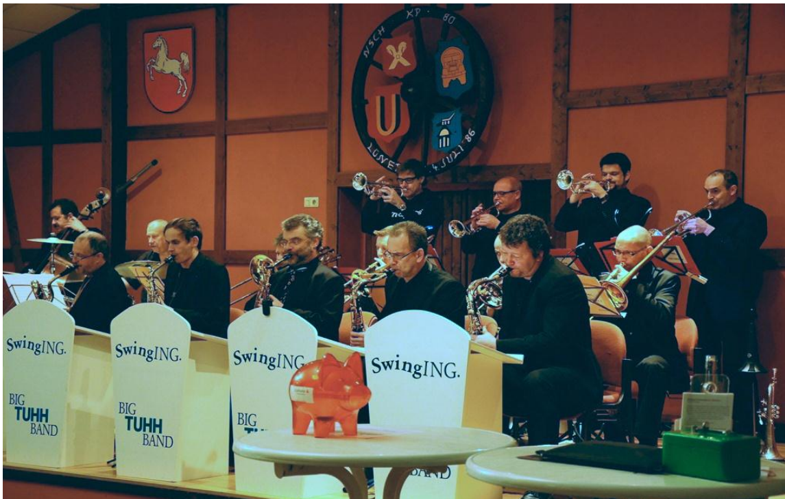
„BigBand-SwingING“ der TUHH am 28.11.2011 im Schützenhaus

Ein Dank gebührt auch den vielen Helfern, die mit Engagement und Ideen Projekte zugunsten unserer Stiftung auf den Weg gebracht oder unterstützt haben. So erbrachte das Johannesfest, das ganz im Zeichen der Stiftung und dem Abschluss der Bonifizierungsrunde stand, einen Erlös von 1.548,- Euro. Hinzu kommt noch der Erlös aus dem Bigband - Konzert von 1.370,- Euro. Neben diesen Veranstaltungen gab es weitere Initiativen und Aktionen zugunsten der Stiftung (z.B. „Pfingstbäumchen“, „Stift und Stifti“ usw.).